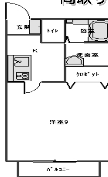
バルコニー西向き